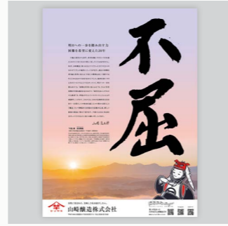
山崎醸造 新聞広告 CL: 山崎醸造株式会社

取材協力: NOBI by SUZUKI COFFEE、株式会社 鈴木コーヒー、社会福祉法人中越福祉会 みのわの里ようこそ STAFF: アートディレクター: 山本 拓志/デザイナー: 小林 南穂/題字デザイン: 宮 未尋/エディター: 山本 嗣也 ライター: 河内 千春 発行元: 株式会社ネオス 〒940-0084 新潟県長岡市幸町 1-3-10 パートナースプラザ内 TEL: 0258-33-8836 MAIL: info@neos-design.co.jp