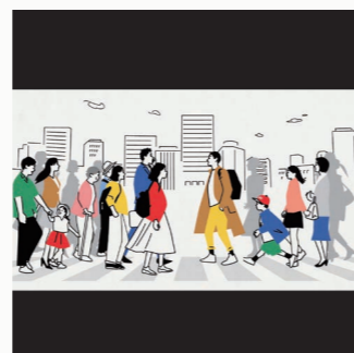
JAPEX シネアド CL: 石油資源開発株式会社 (JAPEX)