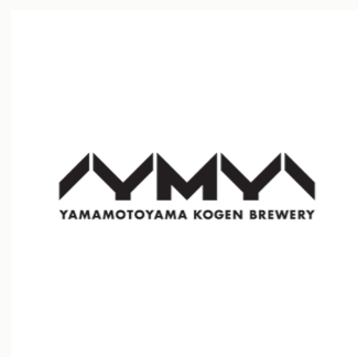
山本山高原ブルワリー ロゴ CL: 株式会社アグリたかの