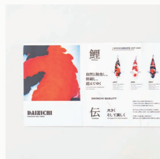
大日養鯉場 パンフレット CL: 大日養鯉場株式会社