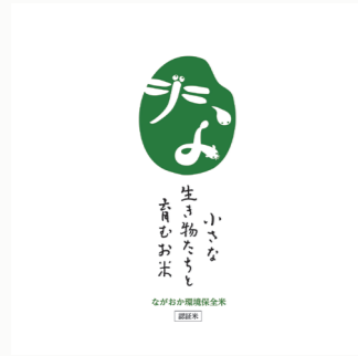
小さな生き物たちと育むお米 ロゴ CL: 長岡市