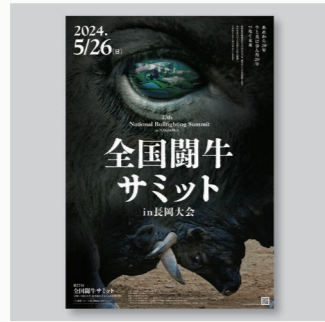
全国闘牛サミット in 長岡大会 ツール CL: 全国闘牛サミット in 長岡大会実行委員会