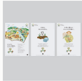
N サイクル ポスター CL: N サイクルプロジェクト