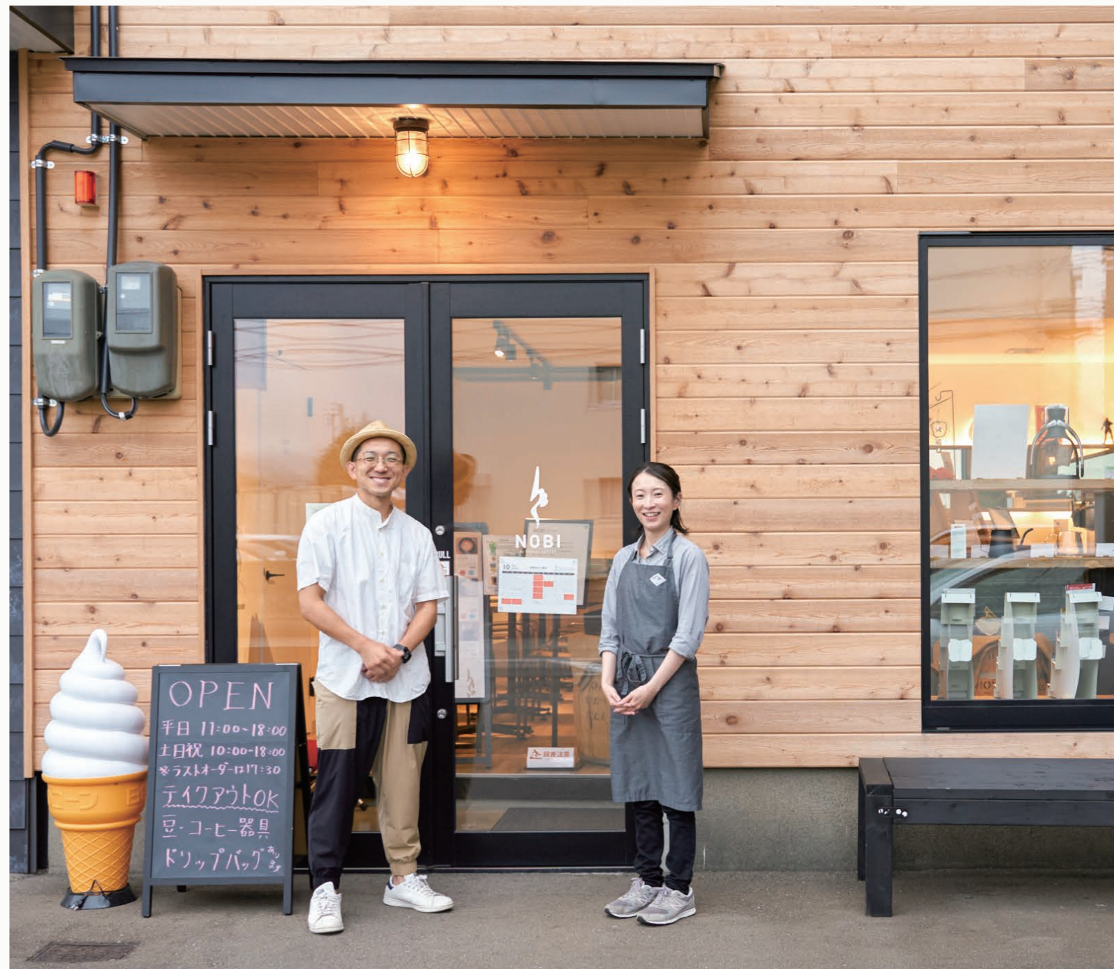
「Neo spotlight」はデザインので地域ブランドやまだ知られていない地域の魅力にスポットライトを当て、紹介するフリーペーパーです。